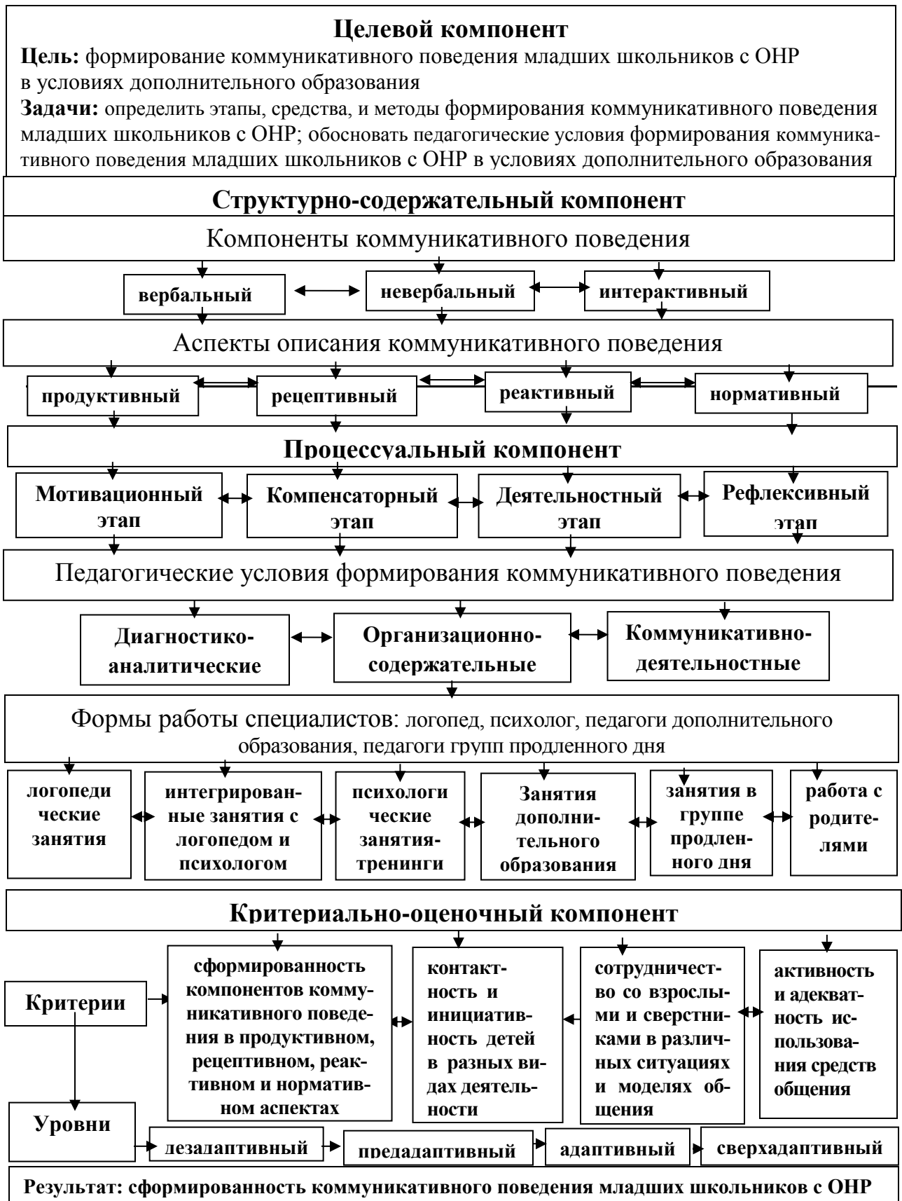
Рис. 1. Модель формирования коммуникативного поведения младших школьников с ОНР в условиях дополнительного образования